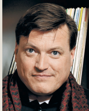
Peter Ruzicka, Christian Thielemann