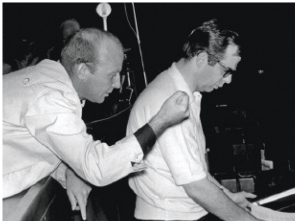
Christoph von Dohnányi e Hans Werner Henze in una pausa delle prove, Salisburgo, 1966