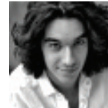
VIOLINO NEMANJA RADULOVIC