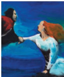
OPERA IN TRE ATTI LIBRETTO DI RICHARD WAGNER