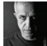
DIRETTORE E VIOLONCELLO SOLISTA GIOVANNI SOLLIMA

GIOVANNI SOLLIMA BREVE IMPROVVISAZIONE AL CELLO SOLO