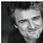
DIRETTORE INGO METZMACHER