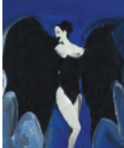
BALLETO IN DUE ATTI