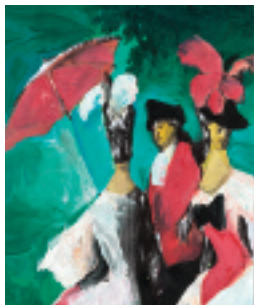
OPERA IN TRE PARTI LIBRETTO DI LUIGI BALOCCHI