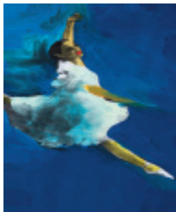
BALLETO IN DUE ATTI LIBRETTO DI THÉOPHILE GAUTIER