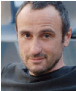
GIORGIO BARBERIO CORSETTI